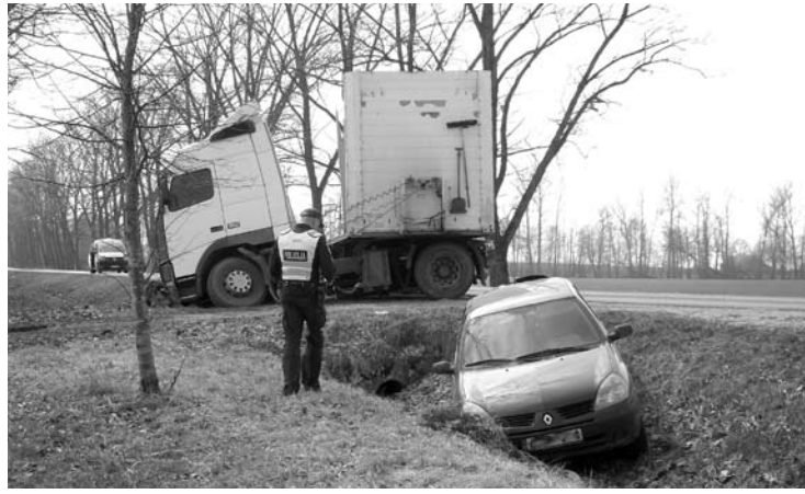
„Renault Clio“ nuo smūgio nulėkė kelis metrus.

Kuriam laikui avarijos vietoje viena eismo juosta buvo užtvirta. Eismą reguliavo policijos pareigūnai.