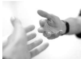
Užsak. Nr. 417

asmens situaciją, gali pasiūlyti konkrečiai jam aktualias paslaugas – nuo patarimų ir informacijos suteikimo iki trumpųjų intervencijų, stebėsenos.